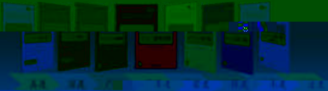
一体化课程教学设计 综合实训基地